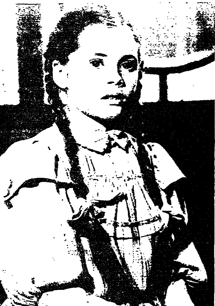
بعد فيلم - ساحر اوز - يطالعنا والت ديزني بفيلم جديد بعنوان - العودة الى اوز - من اخراج والتر مارش وقد استندت الاوار فيه الى كل من فيروزه بلك ليتكول وويليامسون - جان مارش - بيير لوري ومات كلارك . وهذه بعض مشاهد من الفيلم

وهذه مسابقة جديدة للكلمات المتقاطعة تضمها - الاوتار - لقراؤها . وتخصص للفائزين الاولين فيها جوائز مالية كالتالي : ● الجائزة الاولى : ٥٠٠ ليرة لبنانية ● الجائزة الثانية : ٣٠٠ ليرة لبنانية ● يتم اختيار الفائزين بالجازتين بالقرعة من بين الذين ارسلوا حولا صحيحة كاملة . ● تستعد كل مسابقة غير مقطوعة من الجريدة . ● لا يحق للمشارك ارسال اكثر من حل واحد باسمه . ● يجب ان تصلنا الحلول قبل الساعة الثانية من يوم